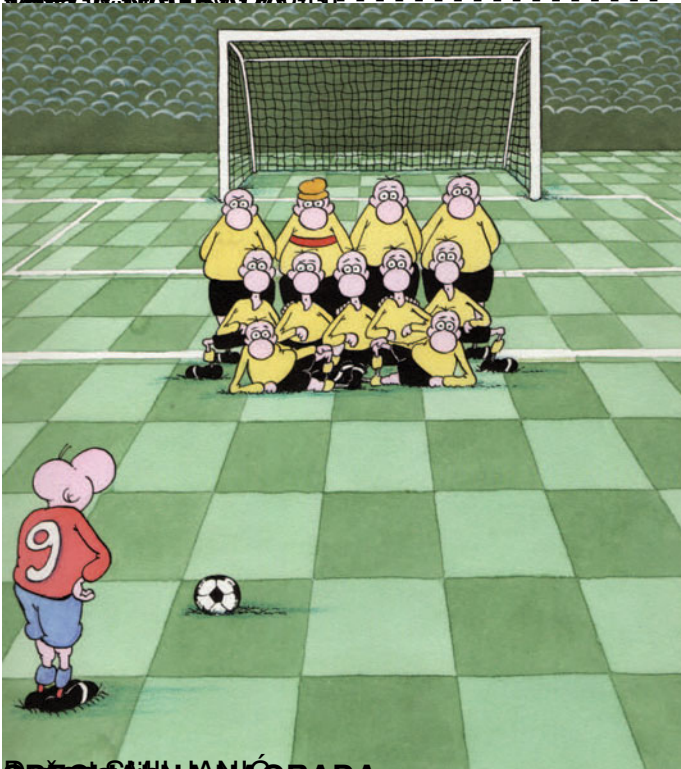
treći salon 1998.