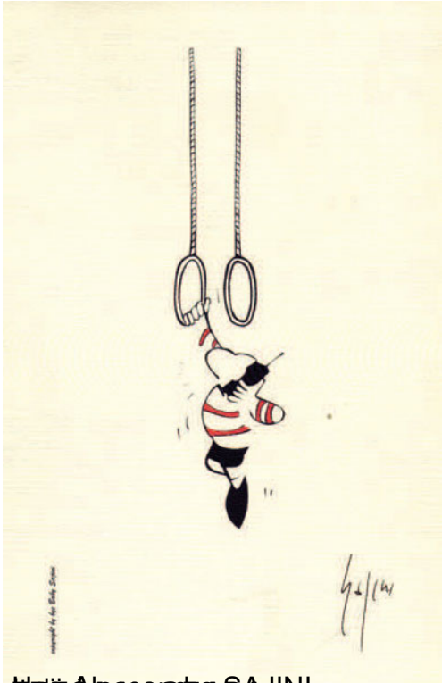
treći salon 1998.