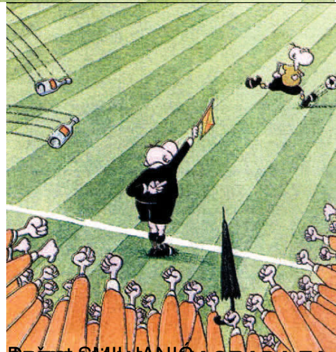
Šteta, BRANIMIR NAGRAĐA ZA NAJZEMUNSKIJU KARIKATURU - - -