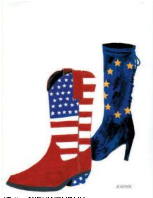
TRIAESTINSALON 2007. -----