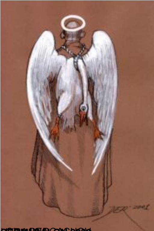
ŠKEMSA ON 2017