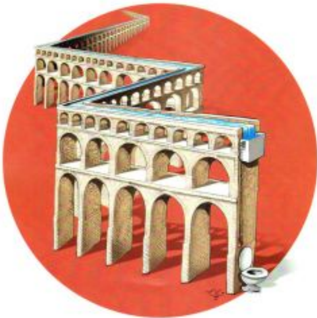
ČERNIŠEVA SALON 2010