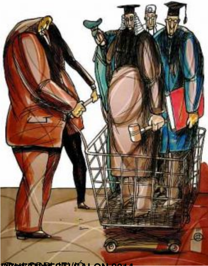
DEVIČARSKI SALON 2014.