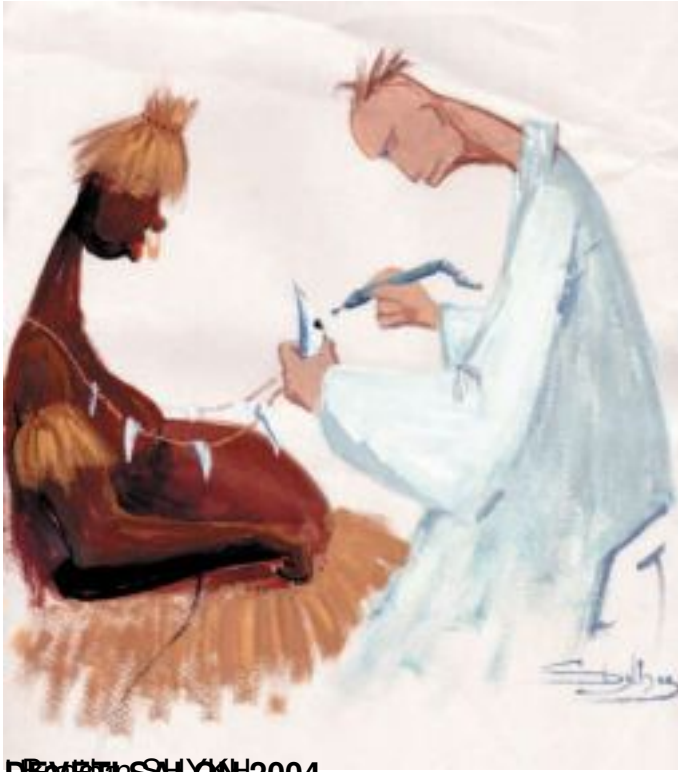
DESETI SALON 2004