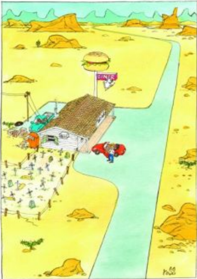
SRPŠKINJE I SALON 2012.