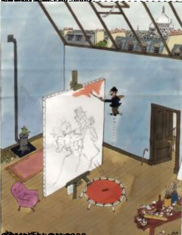
ŠKEMSA ON 2003