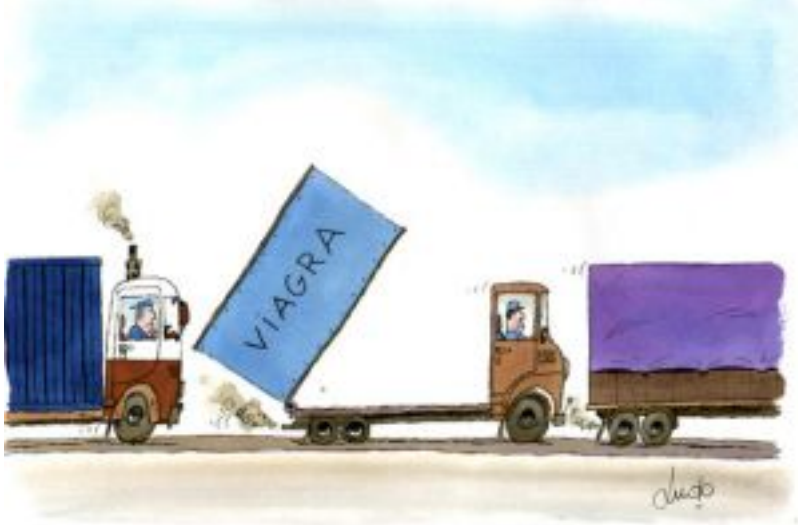
TRIAESTINSALON 2008. -----