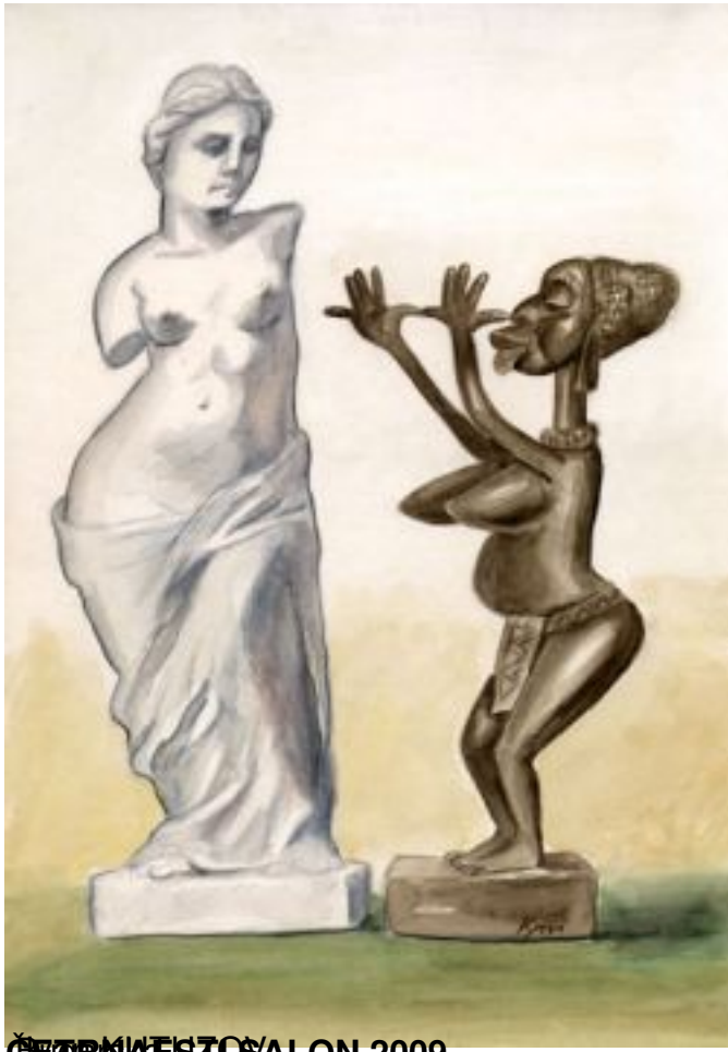
ČERNIŠEVA SALON 2009