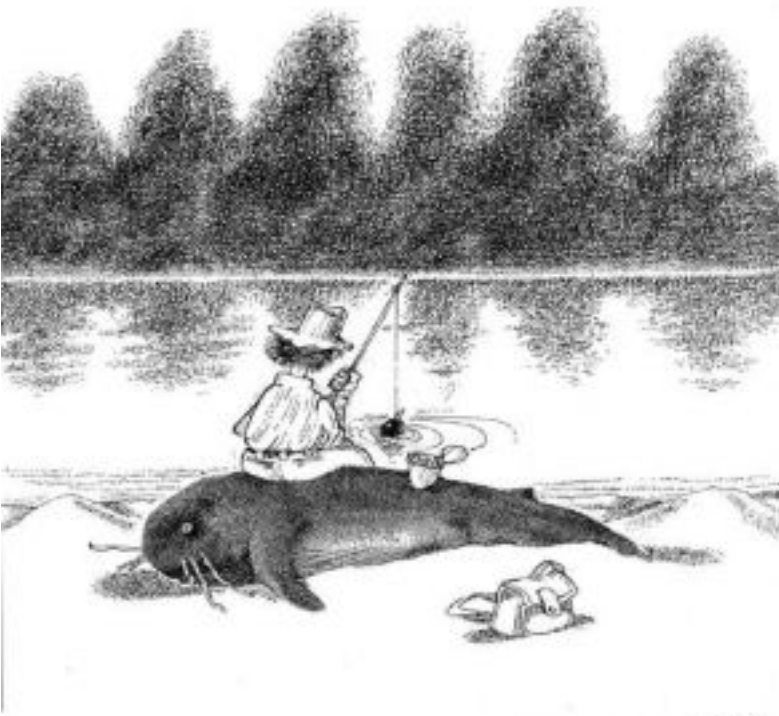
FISH SALON 1998.