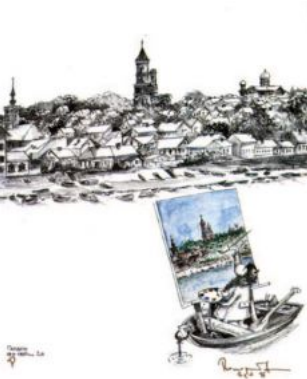
TRAVEL WITH MONIĆ