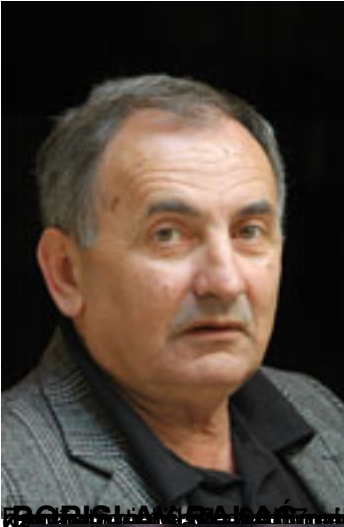
BORIS LAMARCA (1947) – hrvatski skladatelj, dirigent i kompozitor. Član Žirija od 2014. godine. Živi u Zagrebu.